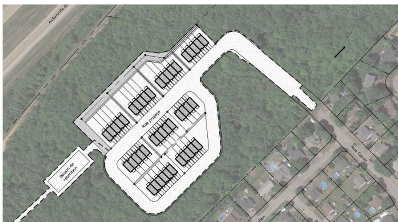
Figure 1: Plan de construction du Plateau III

Saint-Joseph-du-Lac, le 18 janvier 2023 – Les travaux de déboisement et de protection de l'environnement du Plateau III du projet les Plateaux du Ruisseau débuteront en date du 25 janvier 2023 pour une durée approximative de 10 semaines.